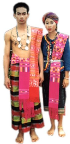
กลุ่มไทยกะเลิง