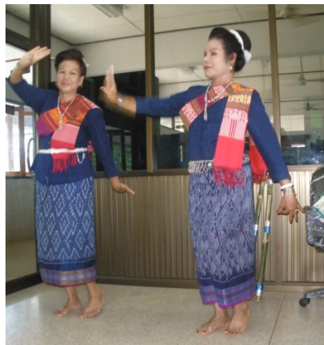
กลับท่าเตรียม