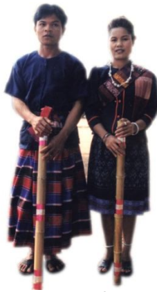
กลุ่มไทใต้

ชาวใต้มีประเพณีที่โดดเด่นเป็นเอกลักษณ์ของตนเองหลายประเพณีโดยเฉพาะ “การพ้อนไล่ทั้งบั้ง”