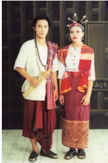
กลุ่มไทโย้ย