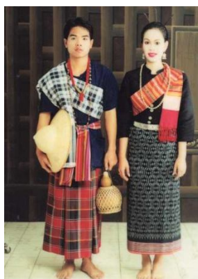
กลุ่มไทลาว

การแต่งกาย แต่เดิมนิยมใช้ชิ้นที่ไม่มีเชิง (ผ้าวันดินเตาะ) แต่ตอนหลังก็นิยมนำผ้าชิ้นตีนจกมาทำเป็นเชิง มีลวดลายสวยงามหลายรูปแบบ และนั่นอาจกล่าวได้ว่า ชิ้นตีนจก เป็นเอกลักษณ์ที่โดดเด่นของชนกลุ่มนี้ จุดเด่นของชนกลุ่มนี้อีกประการหนึ่ง คือ การนิยมใช้ผ้าขะม้า (ผ้าขาวม้า) ทั้งชาย-หญิง ซึ่งแตกต่างจากกลุ่มอื่น ที่มักใช้เฉพาะผู้ชาย ผ้าขะม้าของกลุ่มไทลาว มีชื่อเรียกว่า ผ้าไล่ปลาไหล มีสีเขียว-แดง-เหลือง ทอตามแนวยาวที่ไม่ใช่เป็นผ้าตาหมากรุก นอกจากใช้นุ่ง (สำหรับผู้ชาย) แล้วยังสามารถดัดแปลงใช้เป็นผ้าคล้องคอ ผ้ามัดเอว และใช้เป็นสะไบ(สำหรับผ้าหญิง) ด้วย