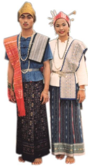
กลุ่มไทญ้อ