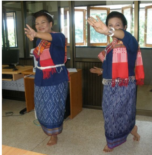
กลับไปท่าเตรียม ทำ ๔ ครั้ง