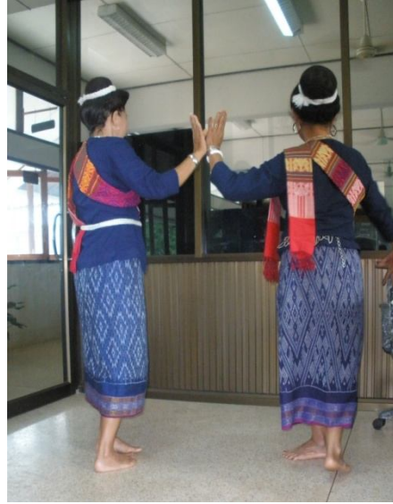
กลับท่าเตรียม