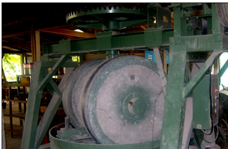
ภาพประกอบ เครื่องบดหิน