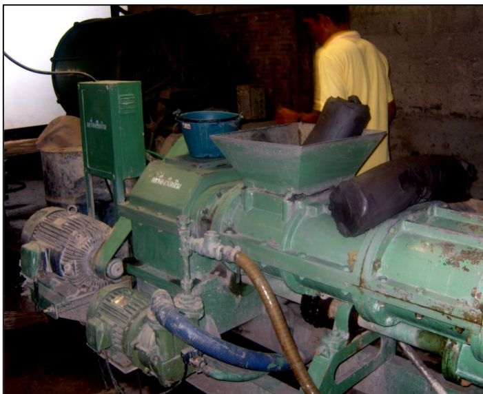
ภาพประกอบ เครื่องรีดดิน