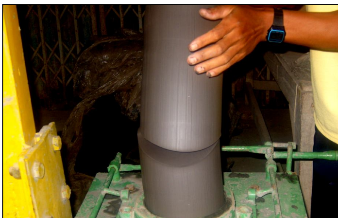
ภาพประกอบ ลักษณะดินที่ผ่านการรีดออกมาแล้ว