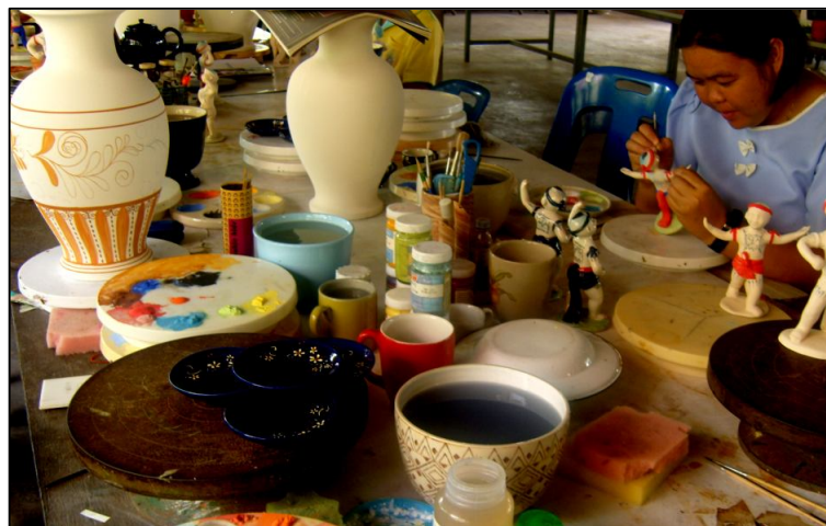
ภาพประกอบ การออกแบบตกแต่งเครื่องปั้นดินเผา