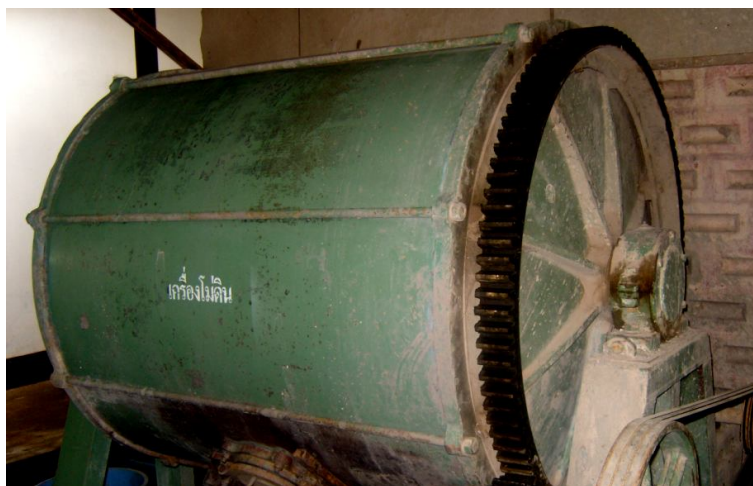
ภาพประกอบ เครื่องโม่ดิน

วัตถุประสงค์การผลิตเครื่องปั้นดินเผาในศูนย์ส่งเสริมศิลปาชีฟบ้านกุดนาขาม