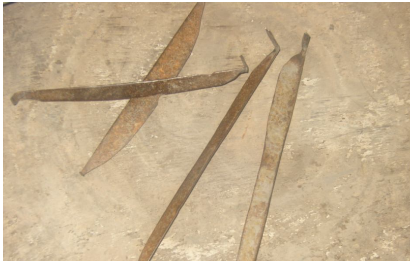
ภาพประกอบ อุปกรณ์ในการตกแต่งรูปลักษณะเครื่องปั้นดินเผา