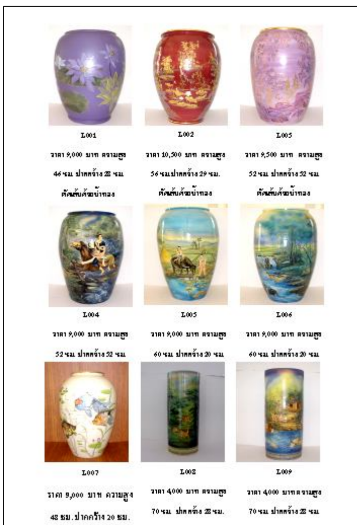
ภาพประกอบ การจัดจำหน่ายผลิตภัณฑ์เครื่องปั้นดินเผา