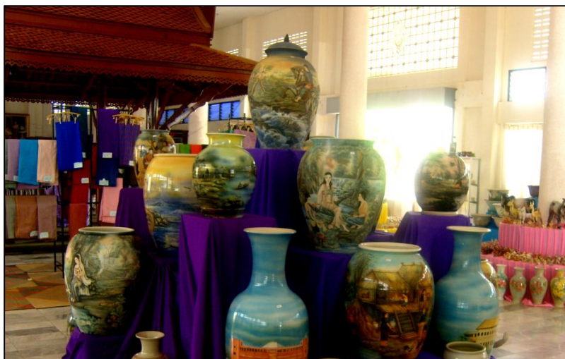
ภาพประกอบ ความหลากหลายของผลิตภัณฑ์เครื่องปั้นดินเผา