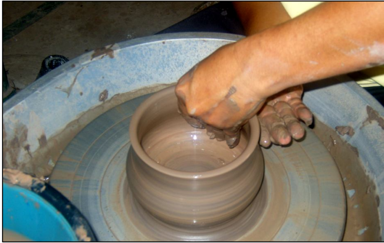
ภาพประกอบ การขึ้นรูปลักษณะเครื่องปั้นดินเผาตามที่ต้องการ