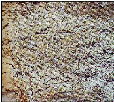
รูปภาพวัวหรือควาย