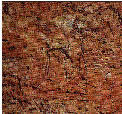
เครื่องมือเกษตรกรรม เช่น จอบหรือเสียม พัดใบกว้างและไถ

๒. ผลการมีส่วนร่วมในการจัดการท่องเที่ยวทางวัฒนธรรมเชิงอนุรักษ์ภูผายนต์พบว่า