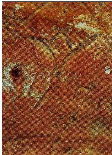
รูปภาพกบหรือเขียดในท่ากระโดด