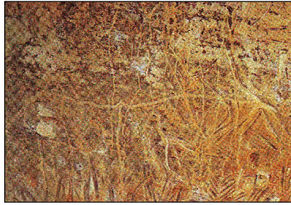
รูปภาพต้นไม้ไผ่หญ้า