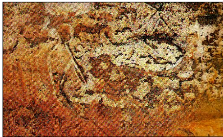
รูปภาพคนกับหมา